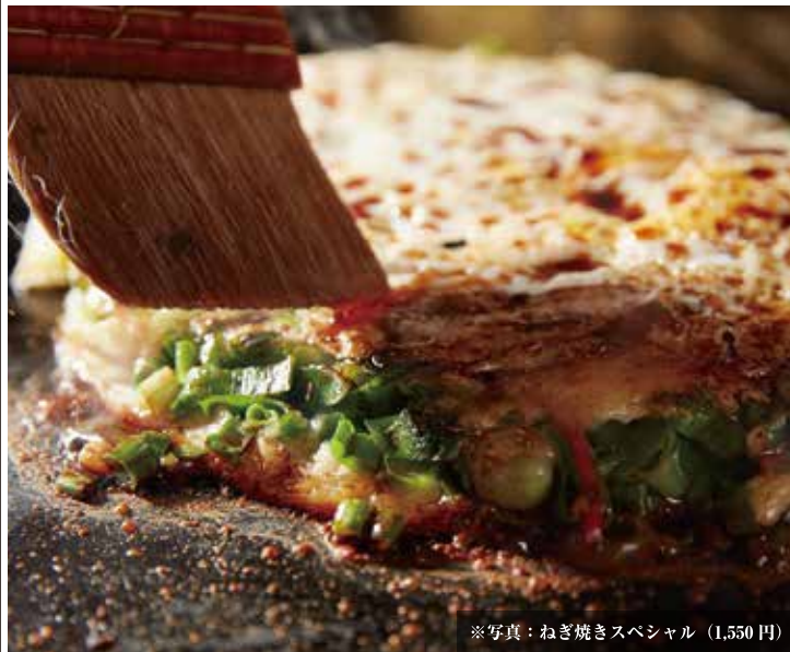
※写真：ねぎ焼きスペシャル (1,550円)