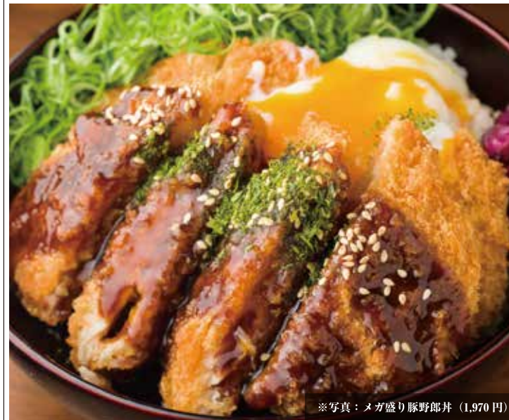
※写真：メガ盛り豚野郎丼（1,970円）